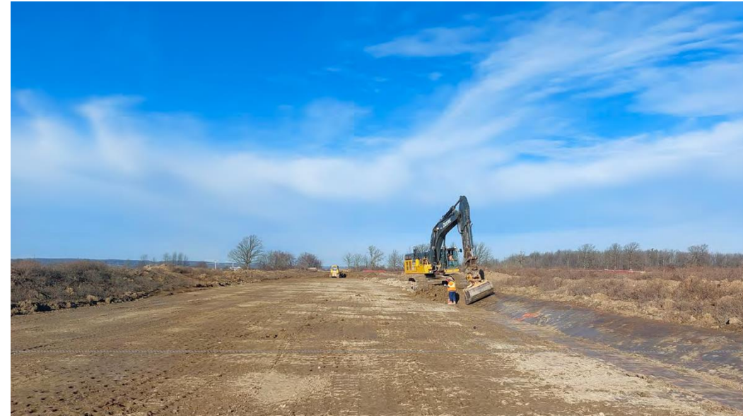
Figure 9 – 5 décembre 2022