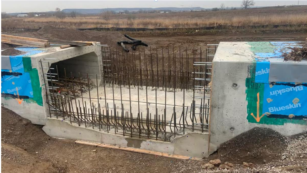
Figure 8 – 29 novembre 2022