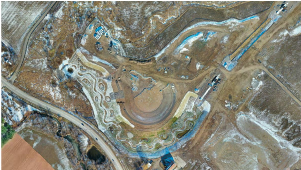
Figure 2 – 19 novembre 2022