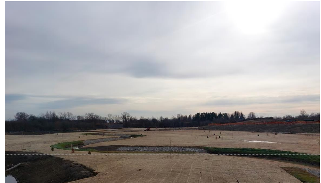
Figure 7 – 5 décembre 2022