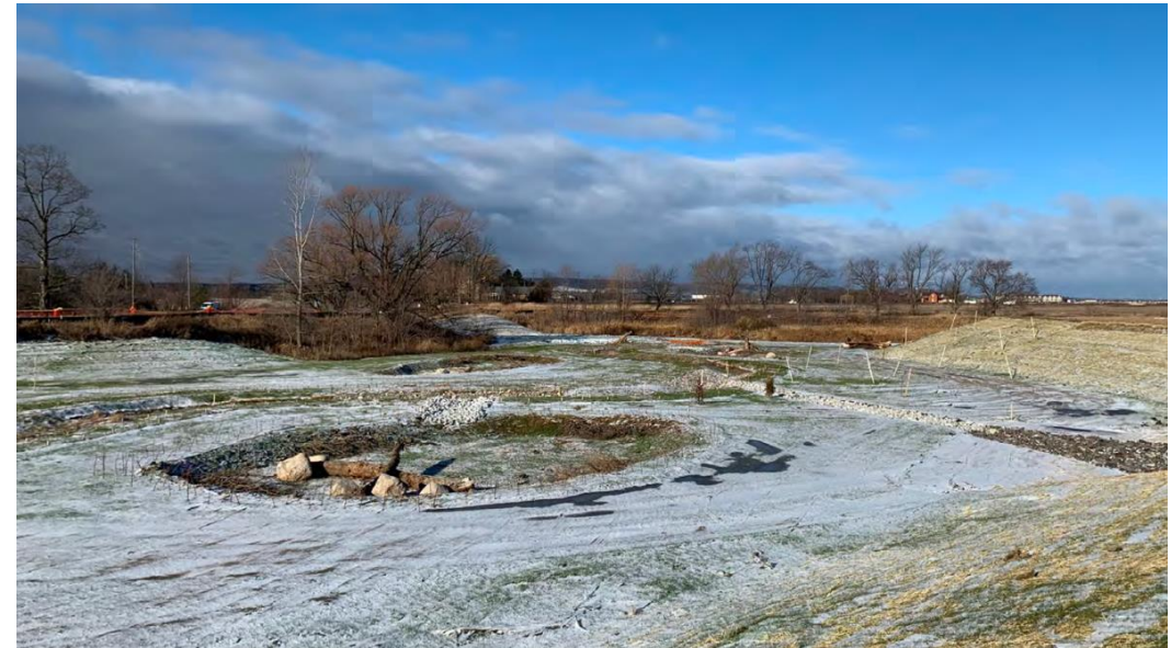
Figure 3 – 1 er décembre 2022