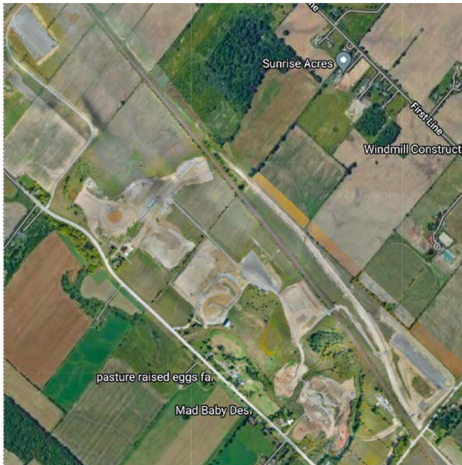
Figure 1a – 20 septembre 2022