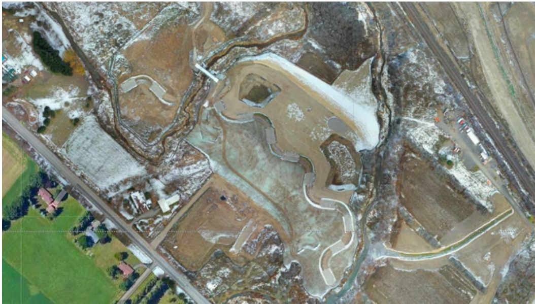
Figure 6 – 19 novembre 2022