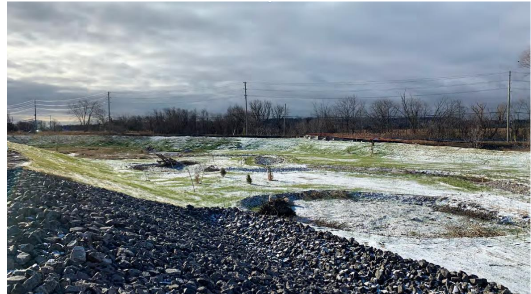
Figure 5 – 1 er décembre 2022