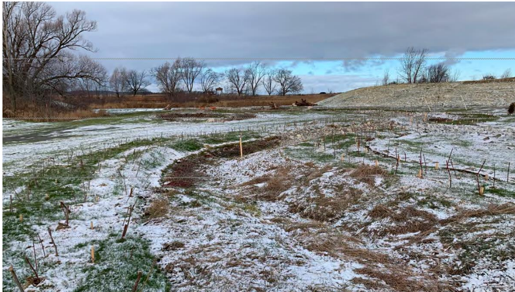
Figure 4 – 1 er décembre 2022