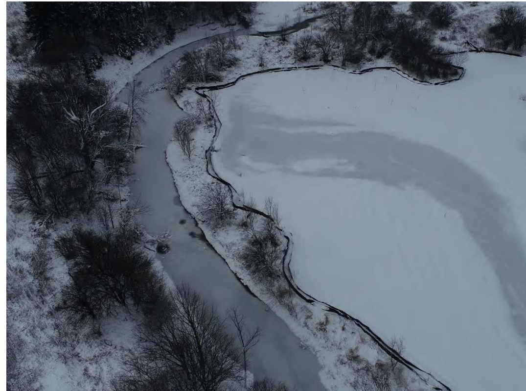
Figure 6 – 27 janvier 2023