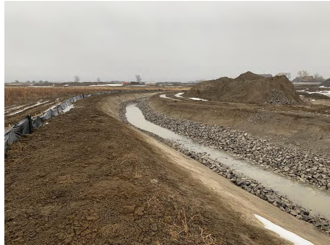
Figure 10 – 23 mars 2023