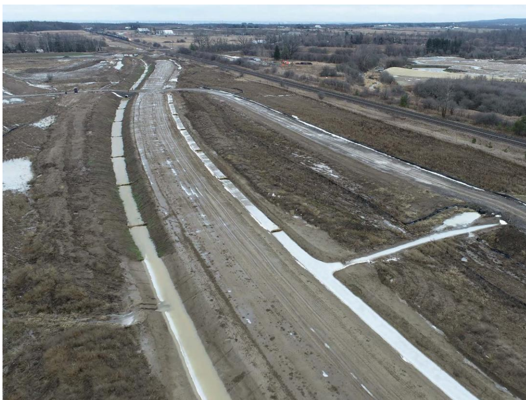
Figure 1 – 18 janvier 2023

Contrôle de l'érosion – barrages de retenue le long des canaux