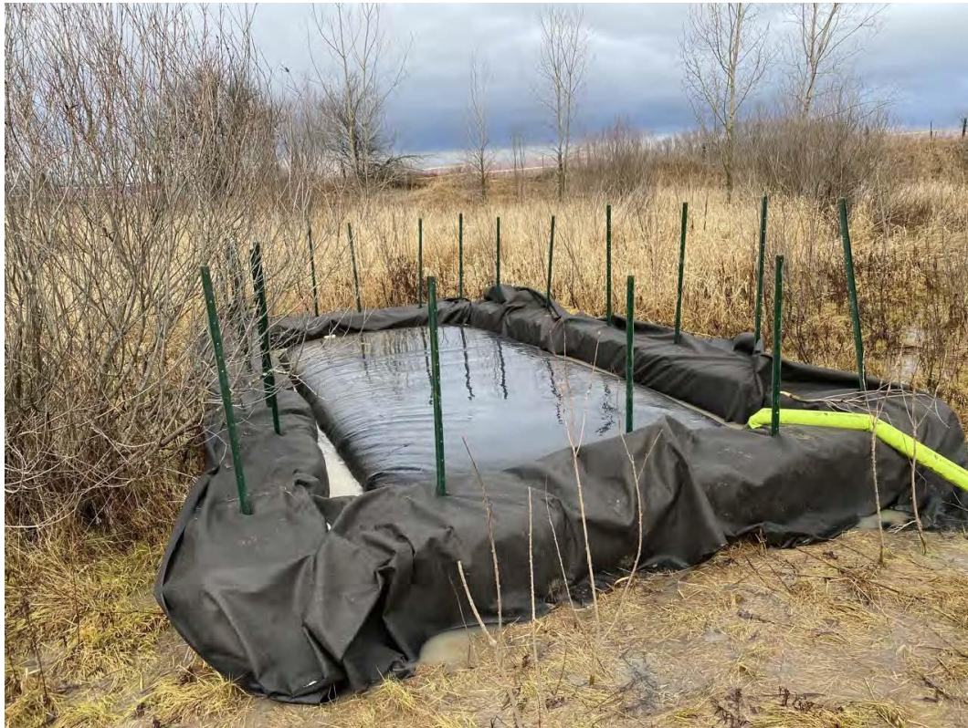
Figure 3 – 20 janvier 2023