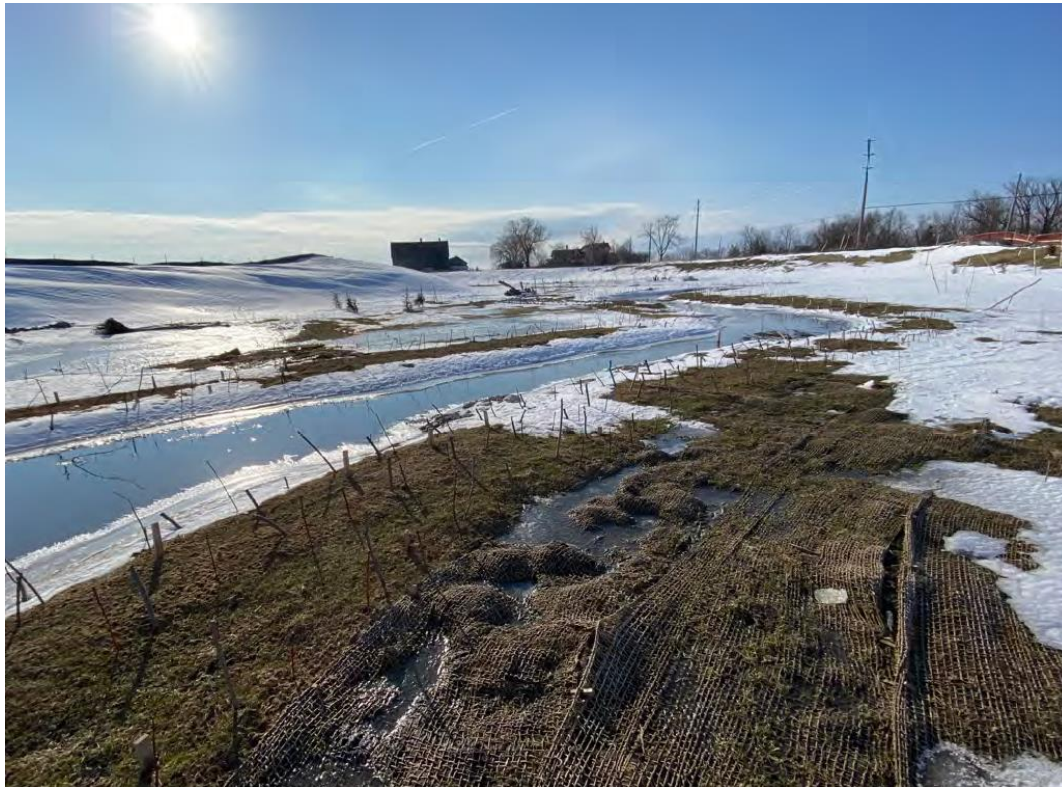
Figure 9 – 16 mars 2023