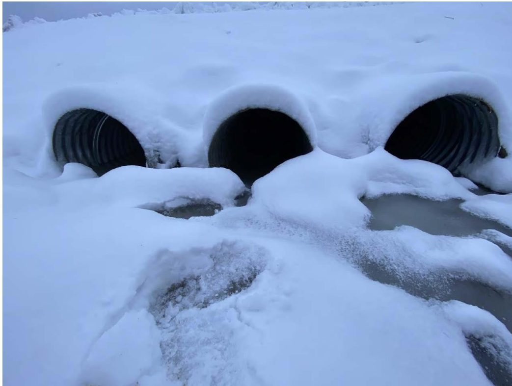
Figure 7 – 23 janvier 2023