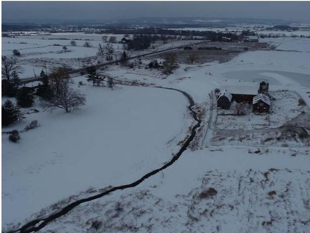
Figure 5 – 27 janvier 2023