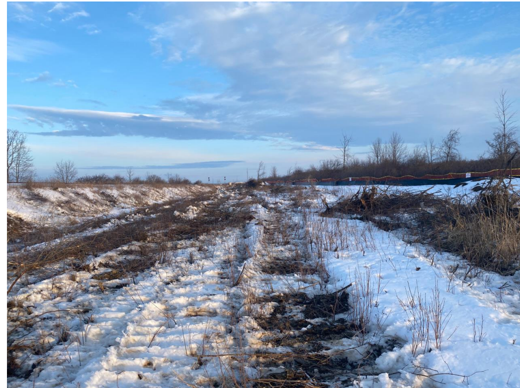
Figure 8 – 16 mars 2023