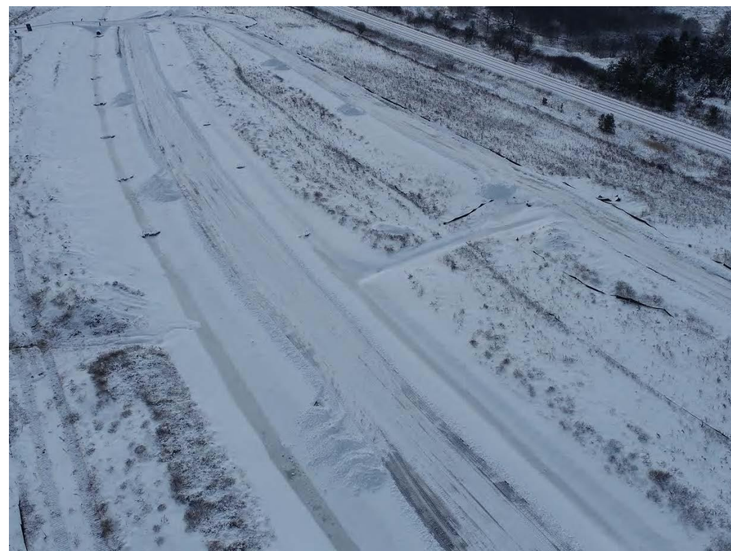
Figure 2 – 27 janvier 2023