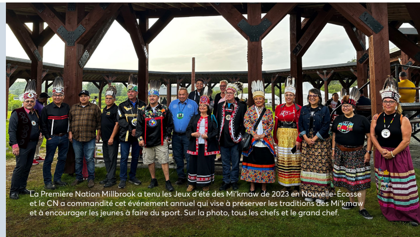
La Première Nation Millbrook a tenu les Jeux d'été des Mi'kmaq de 2023 en Nouvelle-Écosse et le CN a commandité cet événement annuel qui vise à préserver les traditions des Mi'kmaq et à encourager les jeunes à faire du sport. Sur la photo, tous les chefs et le grand chef.