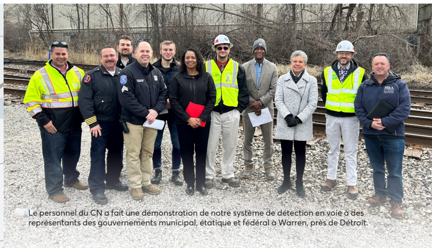
Le personnel du CN a fait une démonstration de notre système de détection en voie à des représentants des gouvernements municipal, étatique et fédéral à Warren, près de Détroit.