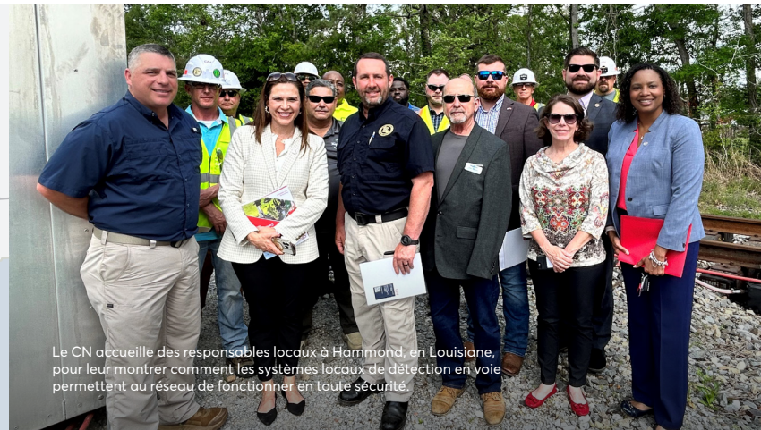
Le CN accueille des responsables locaux à Hammond, en Louisiane, pour leur montrer comment les systèmes locaux de détection en voie permettent au réseau de fonctionner en toute sécurité.