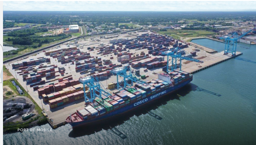
PORT DE MOBILE