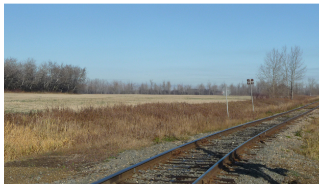
Vue en direction N.-O. à partir du coin S.-E. de la propriété