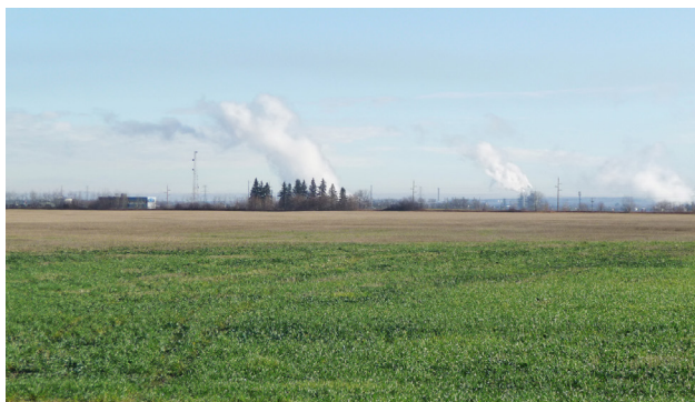
Vue en direction est à travers la propriété à partir du chemin de rang 225