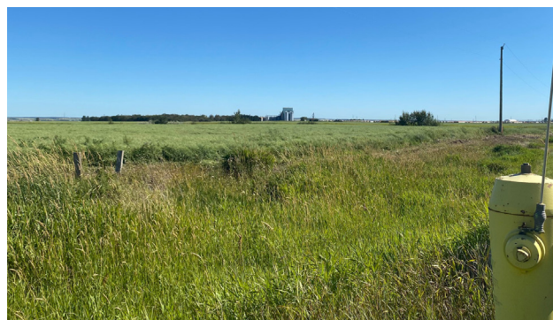
Vue en direction S.-E. à travers la propriété à partir du chemin de rang 225

Des projets pétrochimiques peuvent profiter de subventions dans le cadre du programme incitatif de l'Alberta pour les produits pétrochimiques.