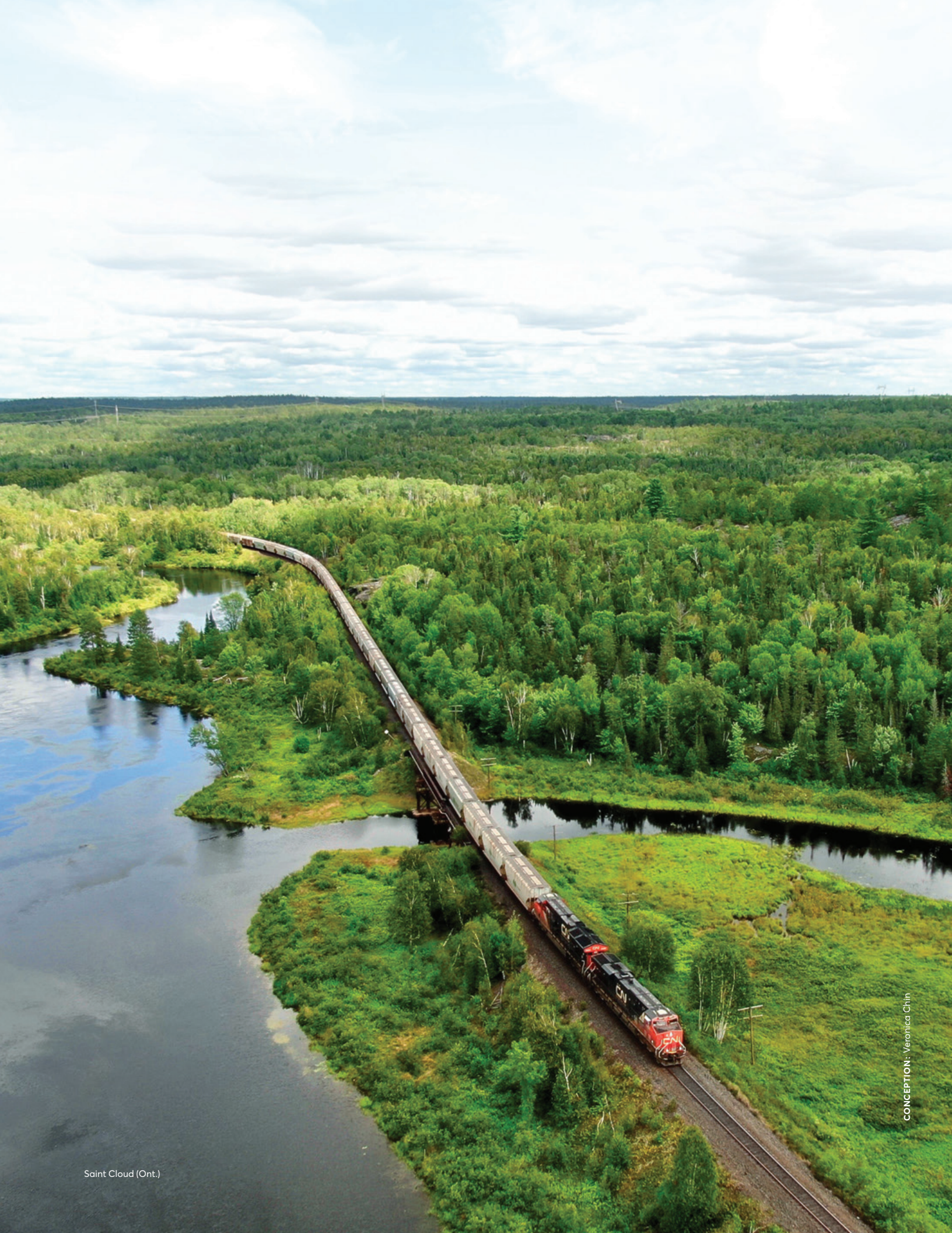
Saint Cloud (Ont.)