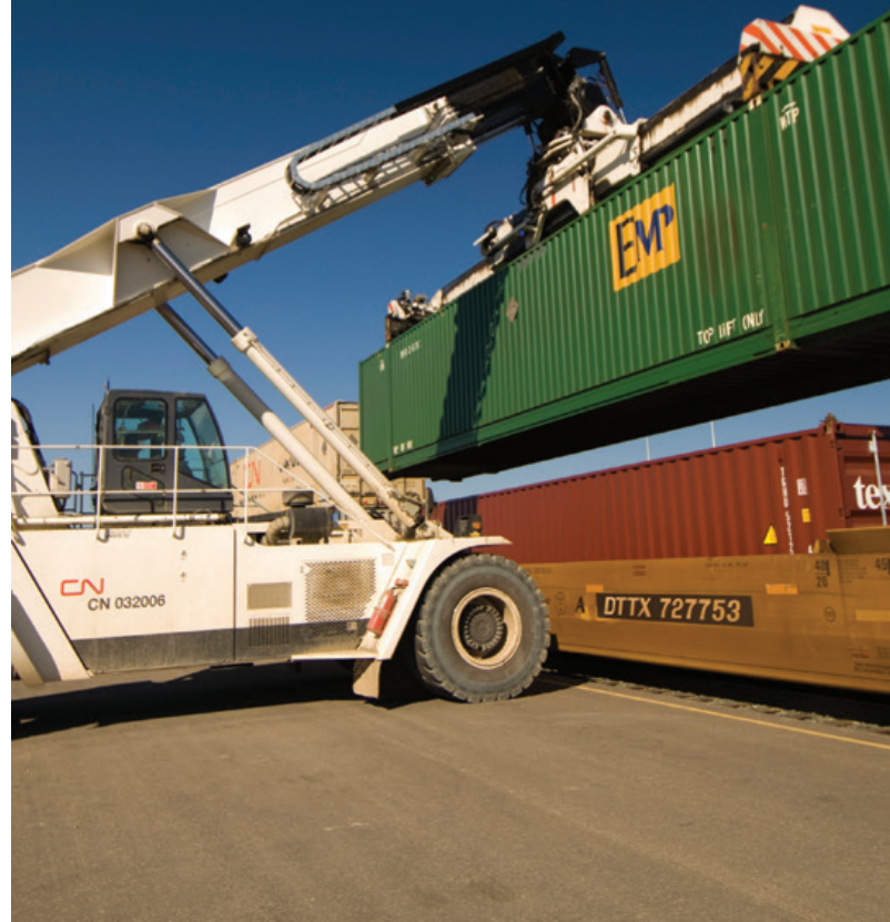
Parc à conteneurs logistique de Calgary (Alb.)

La suite d'interfaces de programmation d'applications (API) du CN propose des outils de visibilité des chaînes d'approvisionnement qui démontrent notre engagement à gérer les chaînes des clients au moyen de systèmes intégrés et de données novatrices.