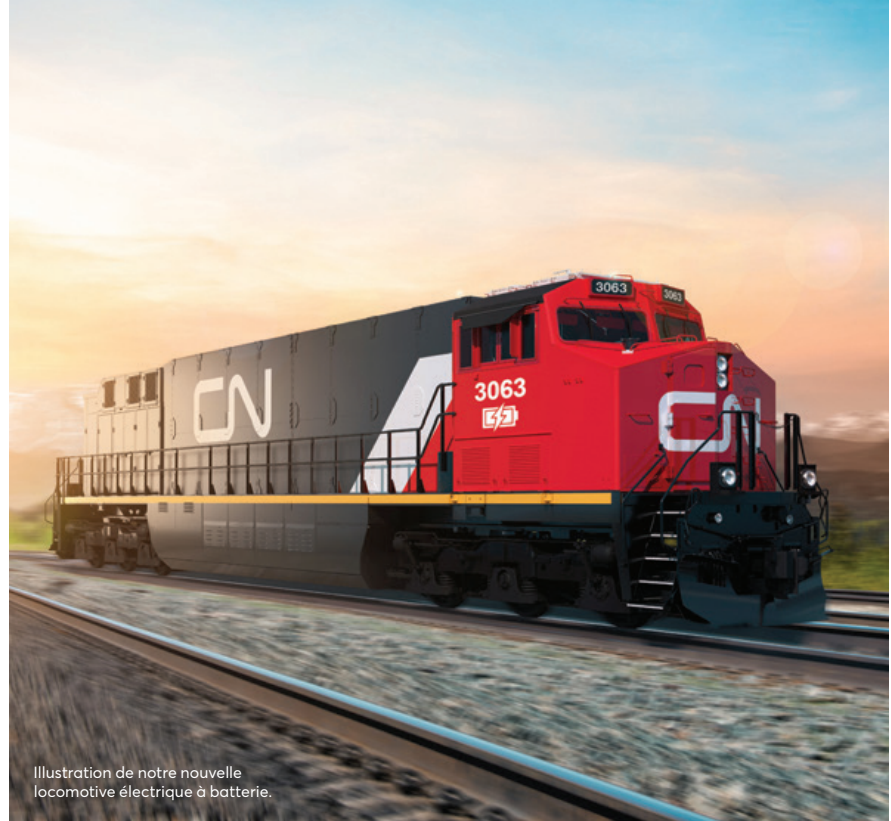
Illustration de notre nouvelle locomotive électrique à batterie.

Pour en savoir plus sur les politiques et les initiatives environnementales, visitez le : www.cn.ca/engagement-responsable/environnement