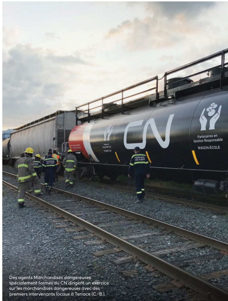
Des agents Marchandises dangereuses spécialement formés du CN dirigent un exercice sur les marchandises dangereuses avec des premiers intervenants locaux à Terrace (C.-B.).

Le CN compte plus de 80 comités patronaux-syndicaux de santé et de sécurité, qui cherchent à éliminer les principales causes d'accidents et de blessures et à renforcer notre culture de la sécurité. Ces comités examinent les problèmes ou incidents de sécurité pour mieux comprendre les tendances et échanger des idées avec le personnel sur le terrain afin de déterminer les points à améliorer et les solutions à mettre en place.