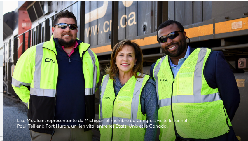
Lisa McClain, représentante du Michigan et membre du Congrès, visite le tunnel Paul-Tellier à Port Huron, un lien vital entre les États-Unis et le Canada.