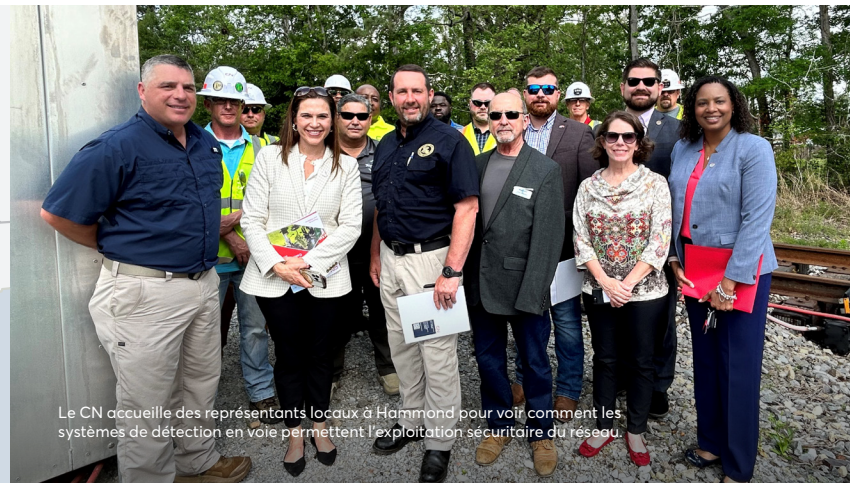
Le CN accueille des représentants locaux à Hammond pour voir comment les systèmes de détection en voie permettent l'exploitation sécuritaire du réseau.